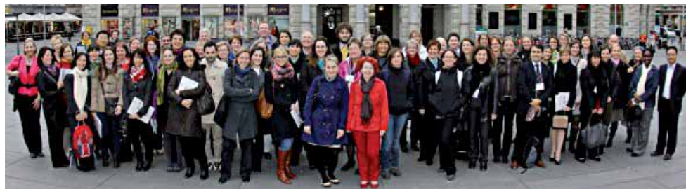
100 ISEP-Koordinatorinnen und -Koordinatoren aus aller Welt trafen sich im April in Graz

Das Symposium, die Vorträge, Diskussionen und Workshops standen unter dem Motto „Collaboration, Communication and Creativity: Leveraging the ISEP Network“. Wie kann die