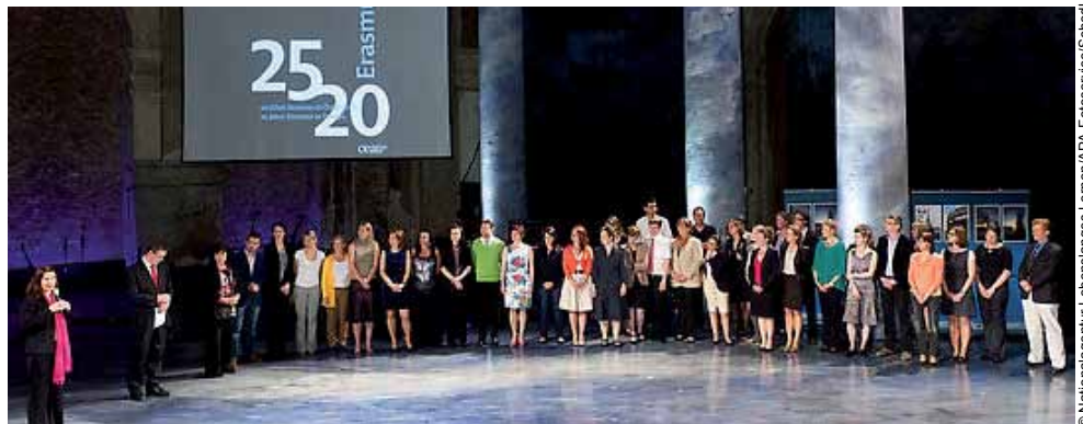
Erasmus feiert Jubiläum: Festveranstaltung in Wien

Für viele ist Erasmus Synonym für alle Mobilitätsprogramme und Austauschstudierenden, auch wenn es sich bei Erasmus eigentlich „nur“ um eine europäische Initiative handelt. Zu Beginn wurde das Programm kritisch beäugt und das Konzept infrage gestellt, der Erfolg gibt Erasmus jedoch recht: Seit 1987 wurden mehr als 2,5 Millionen Auslandsaufenthalte von Studierenden absolviert und über 250.000 Lehrende gefördert. Erasmus ist auch an der TU Graz das größte Mobilitätsprogramm für studienbezogene Auslandsaufenthalte: Erasmus ermöglicht es den Studierenden im Rahmen von Studienaufenthalten und Praktika, fremde Hochschulinstitutionen kennenzulernen, in fremde Bildungssysteme einzutauchen, neue Lehr- und Lernmethoden wahrzunehmen und neue Zugänge zu bekannten Themen zu erfahren. Bekanntes wird infrage gestellt, schätzen ge-