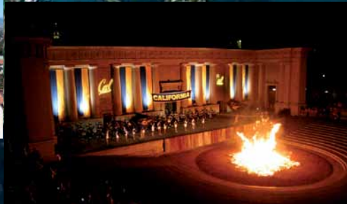
The Big Bonfire am Abend vor dem Big Game gegen Stanford