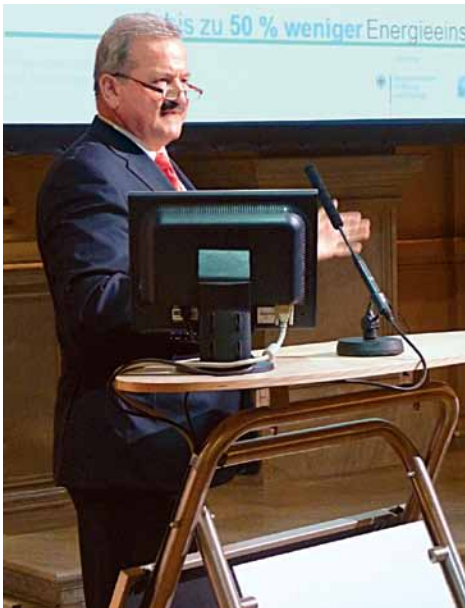
Designierter Präsident der Fraunhofer-Gesellschaft: Reimund Neugebauer