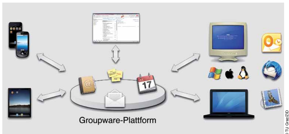
Ihre E-Mails, Termine, Kontakte und Aufgaben – immer und überall

Nachdem eine interne Testphase bisher gut verläuft, ist geplant, im Sommer unter dem Motto „Ihr Organizer – immer und überall“ mit der Umstellung auf das neue System zu beginnen. Was bedeutet das konkret für Sie? Sie können selbst in TUGRAZonline festlegen, wann Ihr TU Graz-E-Mail-Account umgestellt wird; detaillierte Informationen dazu erhalten Sie im Lauf des Sommers. Falls Sie bisher nur E-Mail und keine Kalender oder Adressbücher verwendet haben, dann muss nach der Umstellung lediglich eine Einstellung in Ihrem E-Mail-Programm geändert werden. Wenn Sie schon jetzt Kalender und Kontakte nutzen