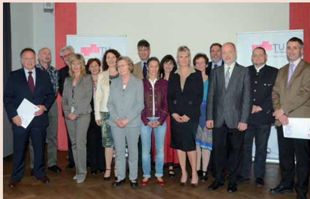
Dienstjubiläarinnen und -jubilare