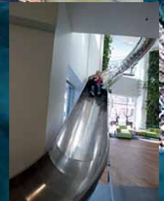
Ausflug ins Silicon Valley mit Besuch des Facebook- und auch Google-Headquarters