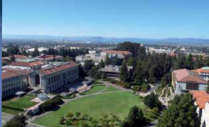
Ausblick vom Campus auf die Bay, die Golden Gate Bridge und San Francisco