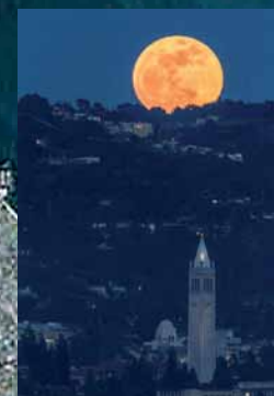
Der Mond über Berkeley

Liebe Grüße aus Berkeley, Iris Uitz Institut für Betriebswirtschaftslehre und Betriebssoziologie