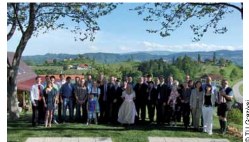
Ausflug des Instituts für Fahrzeugsicherheit mit „alten“ und „neuen“ Teilnehmenden des Masterprogramms „Traffic Accident Research“

dern auch in die steirische Landschaft und ihre Kulinarik zu geben, wurde am 5. Mai vom Institut für Fahrzeugsicherheit zu einem Ausflug in die Südsteiermark geladen. Mit dabei waren auch „frischgebackene“ Expertinnen und Experten der Unfallforschung, die an diesem Tag bei einer stimmungsvollen Graduierungsfeier ihre Urkunden erhalten haben. ■